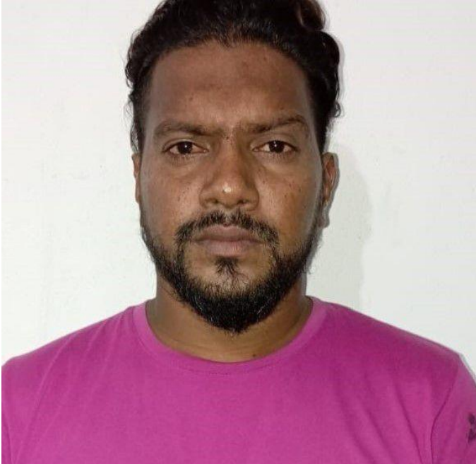
පොලිස් මාධ්‍ය කොට්ඨාසය.